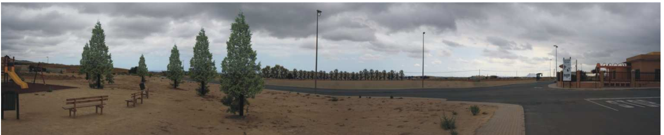
Escenario propuesto 1 (Foto 02)