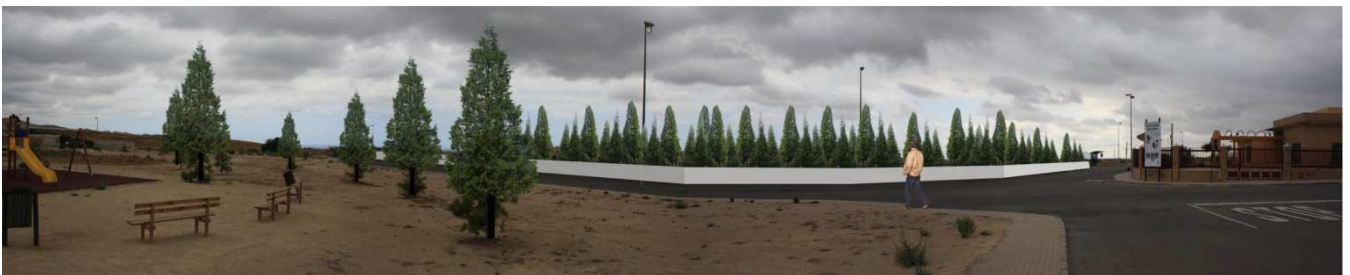
Escenario propuesto 2 (Foto 03)