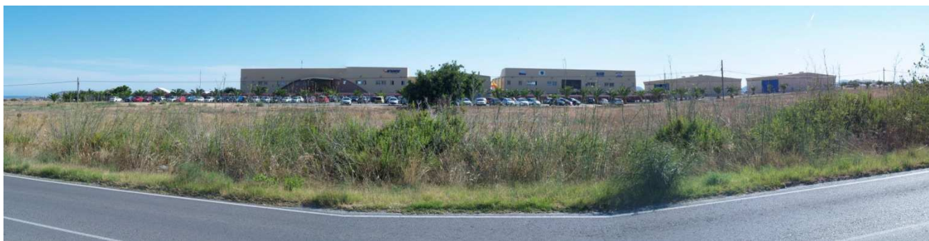
Situación actual (Foto 04)