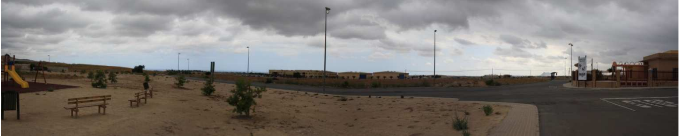
Situación actual (Foto 01)